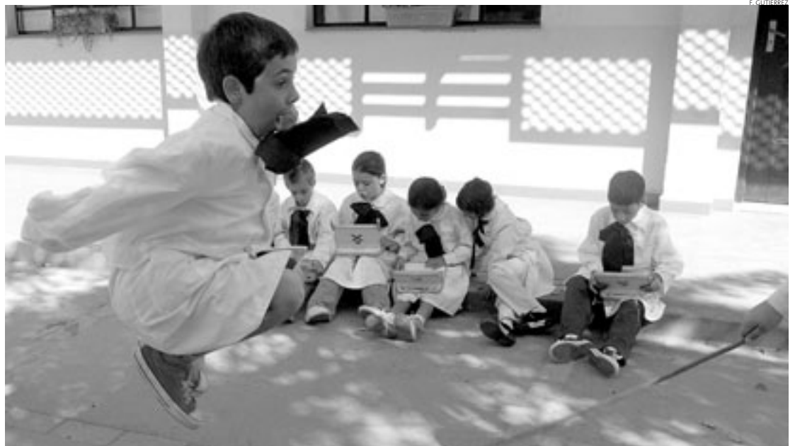
CONEXIÓN. Actualmente en Uruguay se desarrolla el Plan Ceibal que será vinculado al nuevo programa Cardales que se lanzará en febrero

Los ministerios de Industria y Educación, junto a la telefónica estatal y el Laboratorio Tecnológico del Uruguay (LATU) trabajan ahora en la confección de un informe con los detalles del plan Cardales